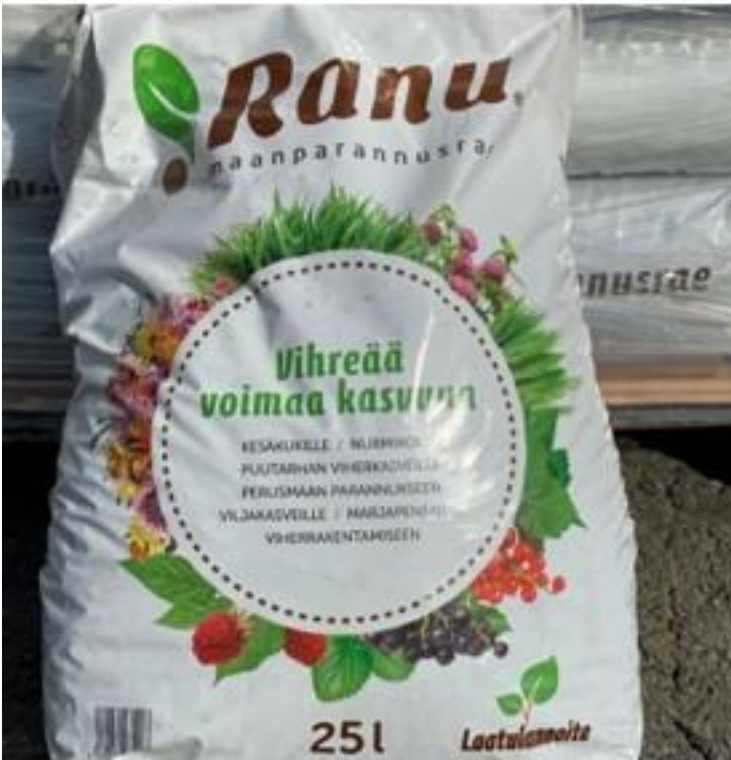
Kuva 2: Ranu-maanparannusrae-valmisteen myyntipakkaus.