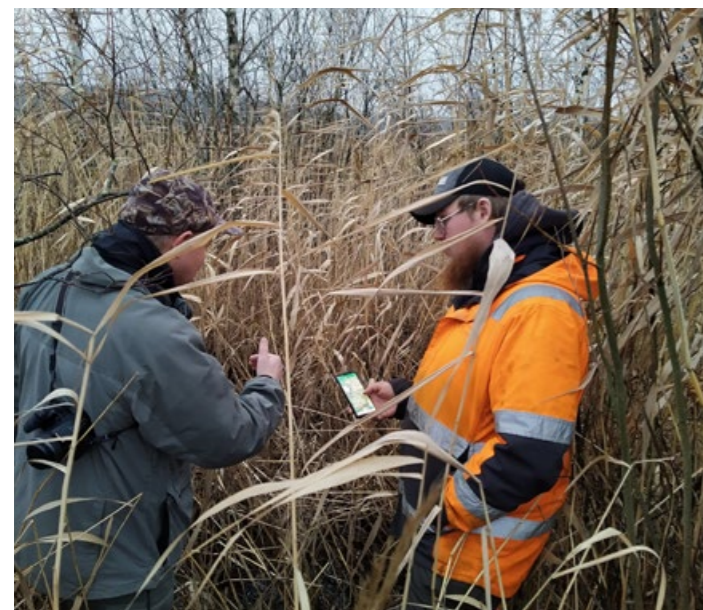
Yhteisellä maastokäynnillä maanomistajien ja niittoyrittäjän kanssa voidaan samalla etsiä ruokomassalle sopivat välivä- rastopaikat ja kuljetusreitit.

Niittoon tarvitaan aina rannan tai vesialueen omistajan suostumus.