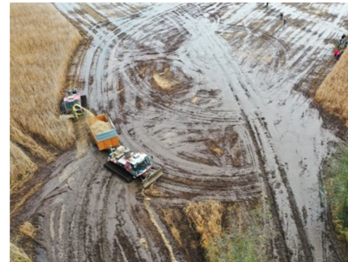
Niitto ja ruo'on keruu vaativat runsaasti ajokertoja raskailla koneilla, mikä kuluttaa pehmeää maapohjaa.