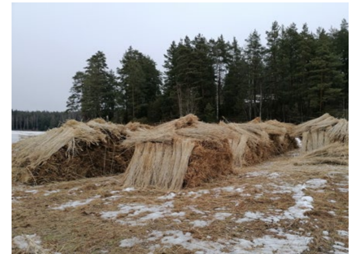
Talviruoko katettuna läjityspaikalle.