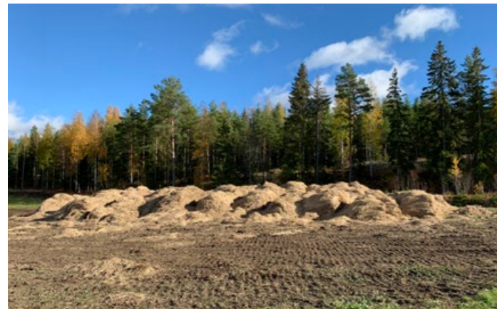
Murskattu ruoko tarvitsee melko suuren varastoalueen.

Niitetty ruoko on sijoitettava niin, ettei se pääse missään vaiheessa tai olosuhteissa takaisin vesistöön.