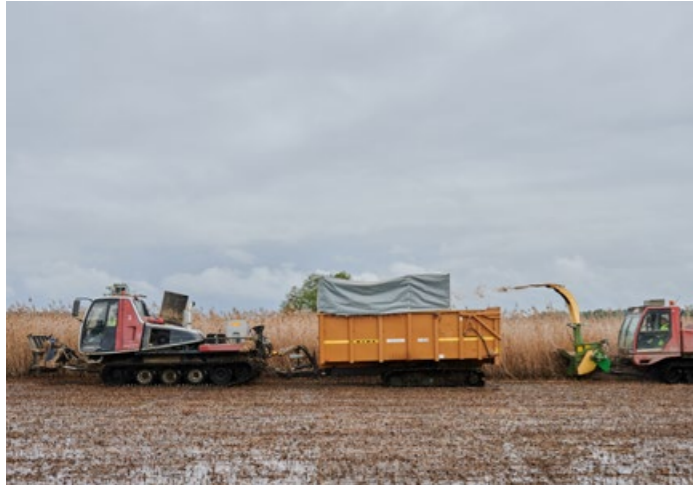
Rinnekonepohjainen niittokone puhalttaa niitetyn ruokomurskan toisen koneen perässä olevalle kuormalavalle.