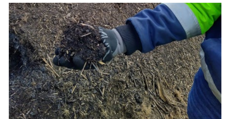
Kasvualustakäyttöä varten loppukesällä niitetyn ruo'on annetaan kompostoitua talven yli aumassa.

Rantaruovikot ovat olleet perinteisiä karjan laidunalueita ja entisaikaan alkukesän ruokoa myös kerättiin yleisesti karjan rehuksi. Parhaiten rehukäyttöön soveltuu ennen juhannusta kerätty ruoko, joka on helposti sulavaa eikä vielä korsiintunutta. Alkukesällä kerätty ruoko myös säilyy paremmin. Kustannustehokkainta ruovikon rehukäyttöä on viedä eläimet laiduntamaan ruovikkoon, jolloin säästetään niiton ja logistiikan kuluilta. Erityisesti naudat syövät tuoretta alkukesän ruokoa mielellään.