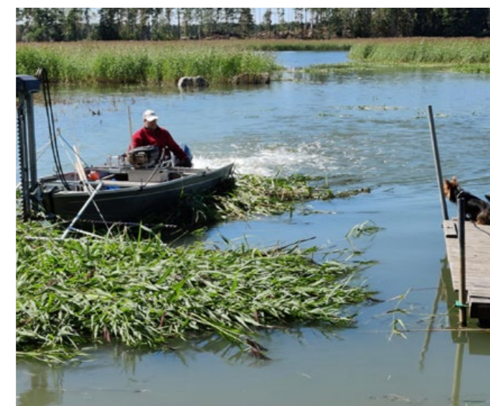
Vesiniitetyn ruo'on työntö veneellä rantaan vie paljon aikaa.

Kone leikkaa ruo'on pitkänä ja jättää sen kellumaan veteen. Ruo'on keruu on niittoa hitaampaa, sillä ruoko pitää joko työntää rantaan Truxoriin vaihdettavalla haravalla tai kerätä erillisellä keruuveneellä. Myös ruo'on nostaminen vesirajasta on työlästä. Talkooväki voi olla iso apu niitetyn ruokomassan keruussa ja kuljetuksessa välivarastolle.