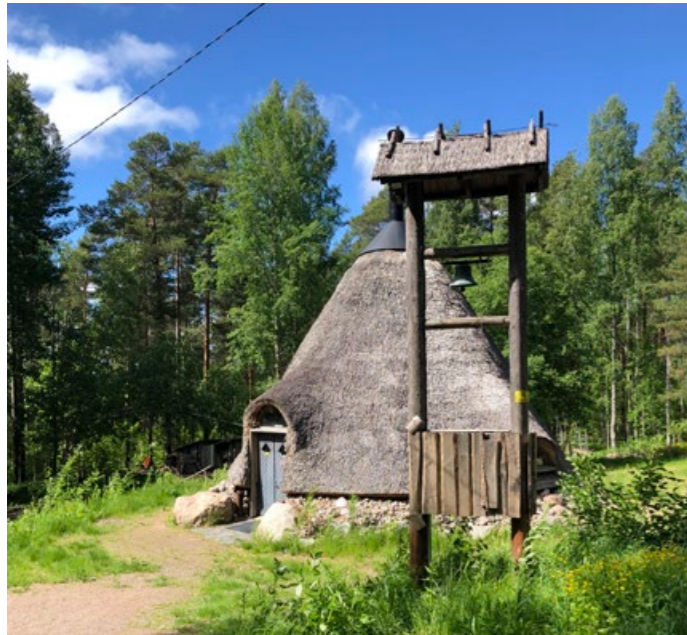
Ruokokattoinen kota Kettumäen kansanpuistossa.