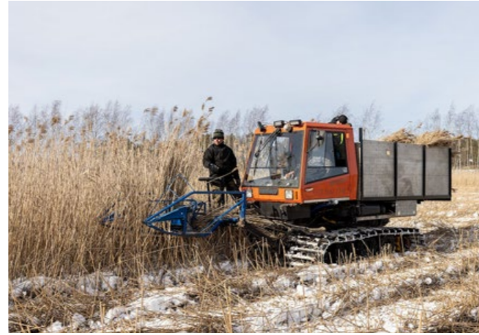
Rinnekonepohjainen niputtava talviniittokone.