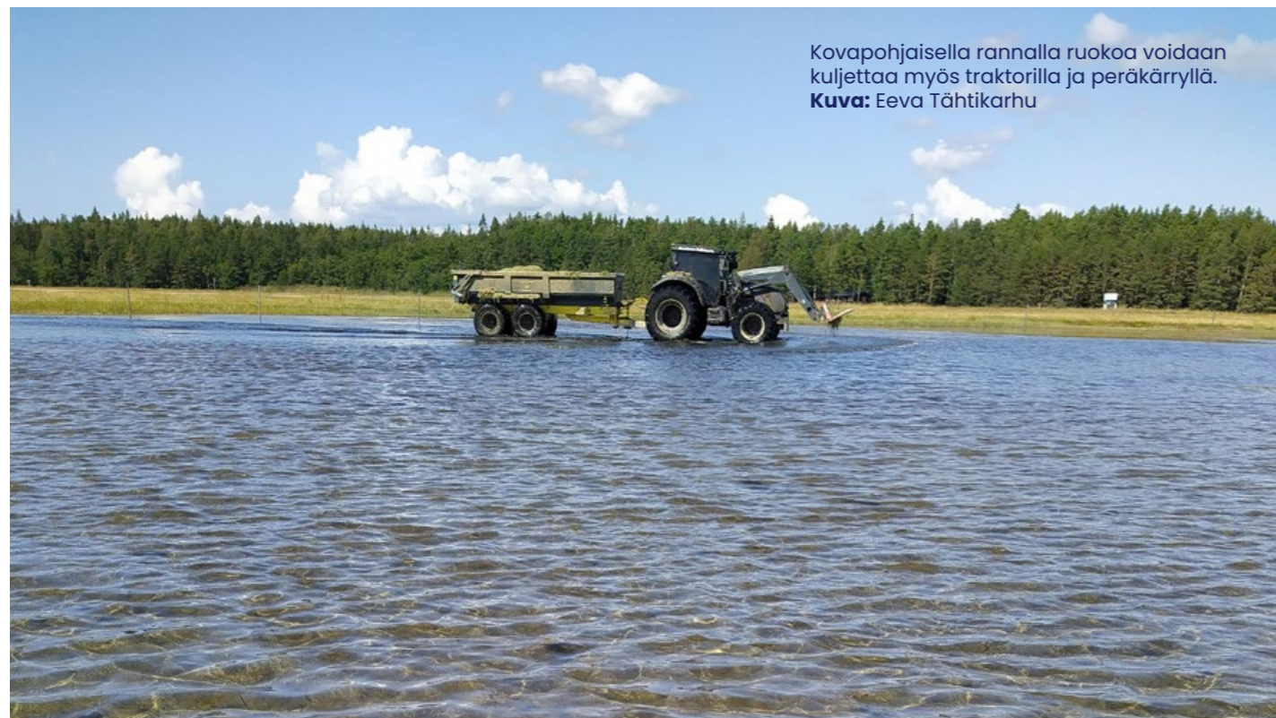
Kovapohjaisella rannalla ruokoa voidaan kuljettaa myös traktorilla ja peräkärryllä.