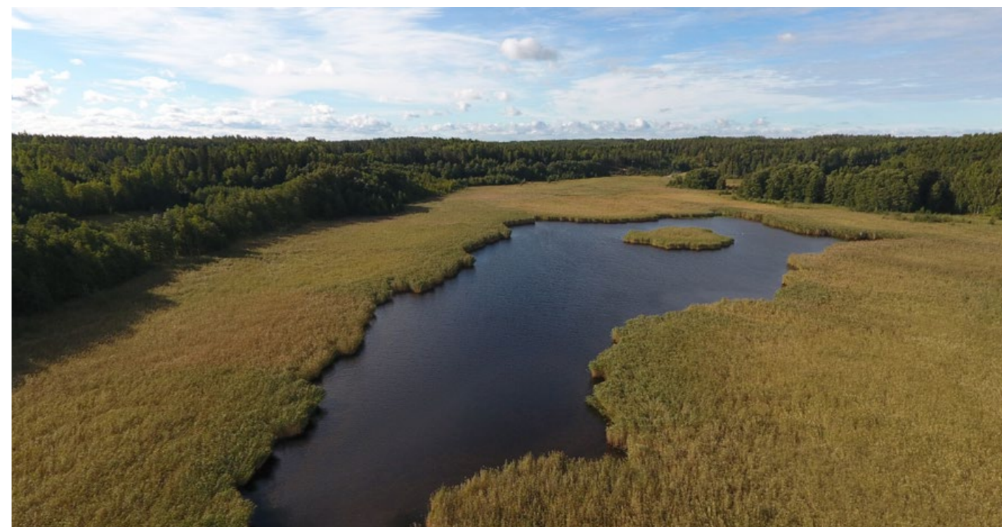
Dronekuvauksesta on hyötyä leikkualueen suunnittelussa.